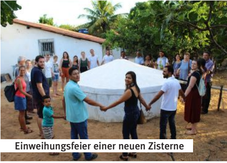
Einweihungsfeier einer neuen Zisterne