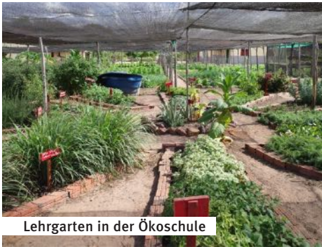
Lehrgarten in der Ökoschule