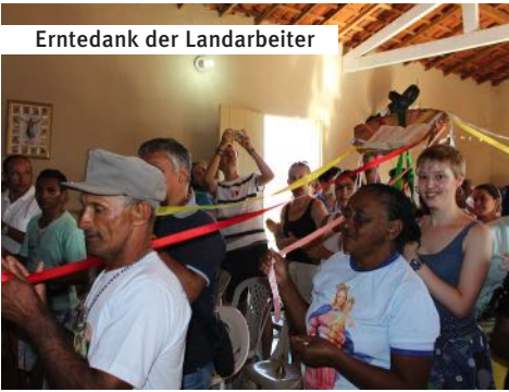
Erntedank der Landarbeiter