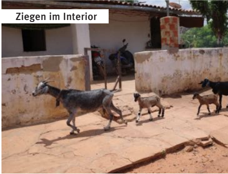
Ziegen im Interio