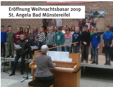
Eröffnung Weihnachtsbasar 2019 St. Angela Bad Münstereifel